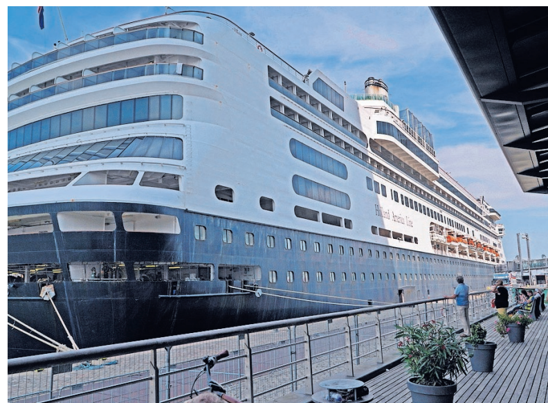
▲ Cruiseschip Rotterdam aan de Wilhelminapier. ‘Cruiseschepen horen bij de stad’, schrijft het college van B en W.

Ook zijn de cruiseschepen die aan de Wilhelminapier aanleggen volgens de gemeente van belang voor de economie van Rotterdam. – Lucette Mascini